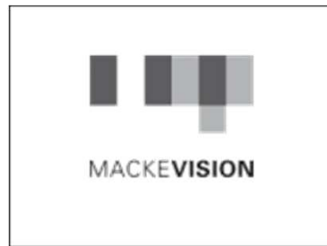
Mackevision Medien Design GmbH, Stuttgart