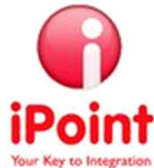
iPoint-systems gmbh , Reutlingen