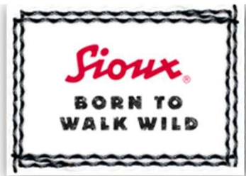
Sioux GmbH, Walheim