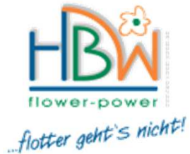
HBW Sinsheim GmbH, Sinsheim