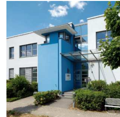
PharmaServiceCenter Verpackungsdienstleistungen Großbeeren