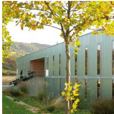
PharmaServiceCenter Packungsbeilagen Binzen