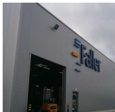
Faller Pharma Packaging Poland Lodz