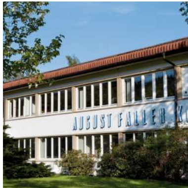
Hauptverwaltung PharmaServiceCenter Faltschachteln Waldkirch