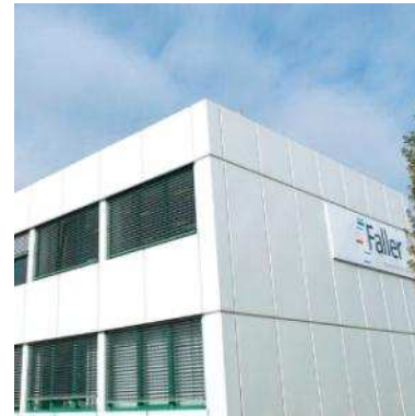
PharmaServiceCenter Etiketten Schopfheim